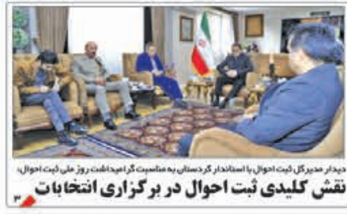
دیدار مدیرکل ثبت احوال با استاندار کردستان به مناسبت روز ملی ثبت احوال، نقش کلیدی ثبت احوال در برگزاری انتخابات