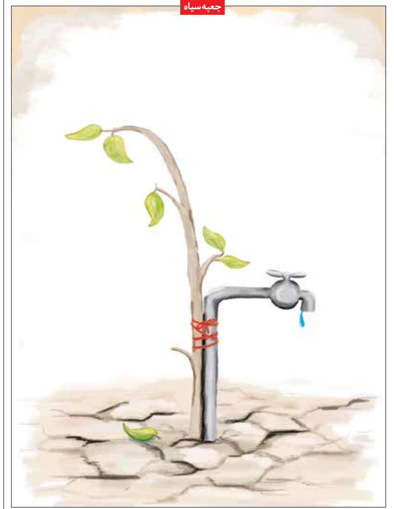
طرح: ناهید زمانی / اصفهان امروز بدون شرح

عبارت است که نام بردارش بود را برای خود برگزید و دیدار با سرمایه‌گذاران بخش خصوصی از جمله هدف‌های سفر سه روزه مدیرکل امور استان‌ها و تشکل‌های مردم‌نهاد وزارت میراث فرهنگی، گردشگری و صنایع دستی به شهرستان کاشان است.