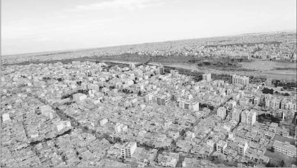
۱۴ تیرماه شهریورماه تیرماه ۱۳۸۳

سال نوزدهم * شماره ۴۷۴۱ * منتهبه ۱۲ دی ۱۴۰۲