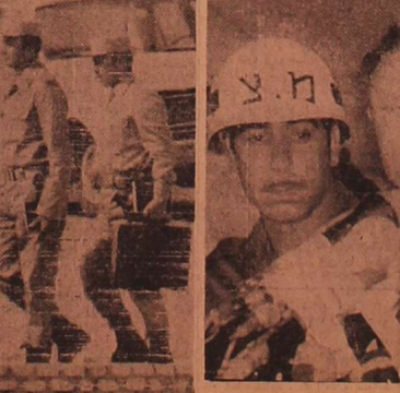
سربازان در خط مقدم