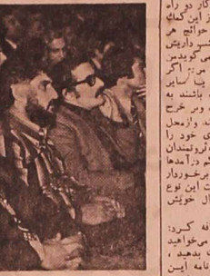
جلسه پرسش و پاسخ کارکنان و کارکنان فیلم ایرانی

ولی یگانه می‌تواند با شرکت واحد تهران، مزایای بسیاری برای شهروندان فراهم کند.