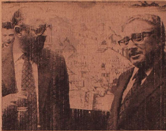
یاسر العلی (چپ) - رهبری کیسینجر، وزیر خارجه آمریکا و ایابان، وزیر خارجه اسرائیل روز پنجشنبه در یک جلسه کوکل در بیت المقدس، پس از اعلام آمادگی اسرائیل، به امضاء قرارداد در مسکو (فراخوانی آسوتیندیس)