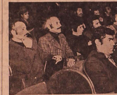
جلسه پرسش و پاسخ کارکنان و کارکنان فیلم ایرانی

توافق تاریخی، توافق مهمی بین طرفین در زمینه همکاری‌های اقتصادی.