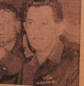
گروهی از نمایندگان در جلسه مذاکره

در کلبو متر ۱۰۱: رئیس ستاد ارتش اسرائیل (الازار)، پس از امضای قرارداد به روزنامه نگاران می‌گوید: آینده نشان خواهد داد که این قرارداد اهمیت تاریخی داشته است یا نه؟ عکس بعد از امضای قرارداد در کلبو متر ۱۰۱، هنگام حرکت بسوی محل امضای قرارداد نشان می‌دهد.