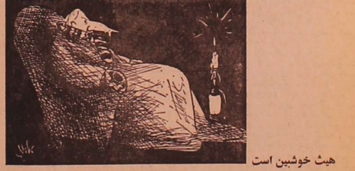
هیث خوشین است

دیوژویک می نویسد: چنان عالی برای شای اذیافت کسینجر مصر و اسرائیل در چه کسکه و موسسه افتخالی که با کسب کند آخر ضرر شکست می‌دهد و تسلیم مبلغ از آنچه گفته بود می‌گردد و نه بودجه موسسه باطله اضافی وصل کنند. چیزی هم از موسسه را تاکنون باز نمانده است، اما نظر میرسد برای آنکه دولت ثابت کند حال که تاجر خوبی نیست، کاسب خوبی است. بدلیل مبالغ دردمان افاده است که علاوه بر آنکه بی‌بهره است، کسالی و ناامنی است. این است، که حکامترین تصویر را بدست می‌دهند.