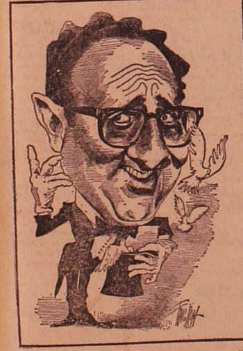
از Bruno (STAMPA)

باینه پروژه دولت کلدماها - در حالی که این پروژه در حال اجراست، نتایج آن هنوز مشخص نیست. این پروژه در راستای اهداف خاصی انجام شده است.