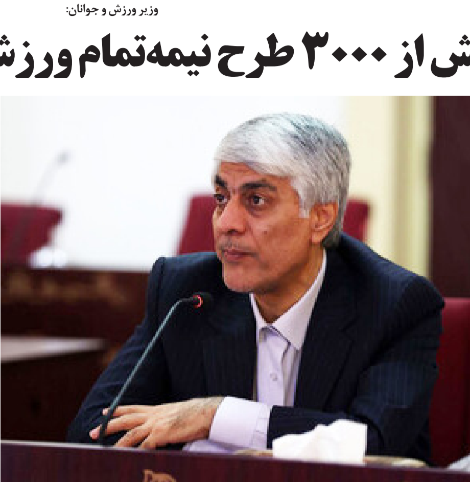
وزیر ورزش و جوانان، سهراب آزاد، در جریان دیدار با اعضای هیئت مدیره فدراسیون فوتبال ایران.

رییس انجمن کراس فیت با بیان این که این رشته را می توان در تمام رده های سنی انجام داد، گفت: ورزش کراس فیت نوعی از سبک زندگی است. سهراب آزاد درمورد مسابقات آیلند گیمز کراس فیت به میزبانی کیش، اظهار داشت: ۴۰۰ نفر برای این مسابقات در ۵ رده مثبت ۴۰، مثبت ۳۵، حرفه‌ای،