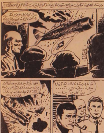
از چه براست