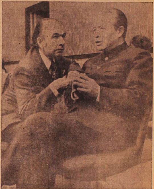
فریتون هویدا، نماینده ایران در سازمان ملل متحد، اندکی قبل از تشکیل جلسه شورای امنیت به اظهارات هوشیارانه نماینده جمهوری خلق چین در سازمان ملل گوش می‌دهد.