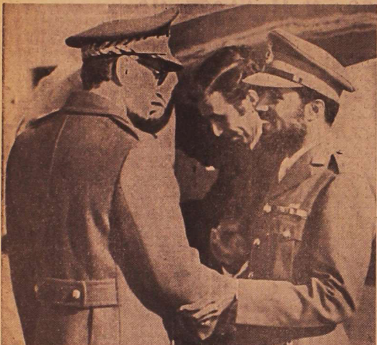
شاهشاه آریامهر از میهمان خود در فرودگاه مهرآباد استقبال میکند. (تکس از گاون خیرنگاران تکس)