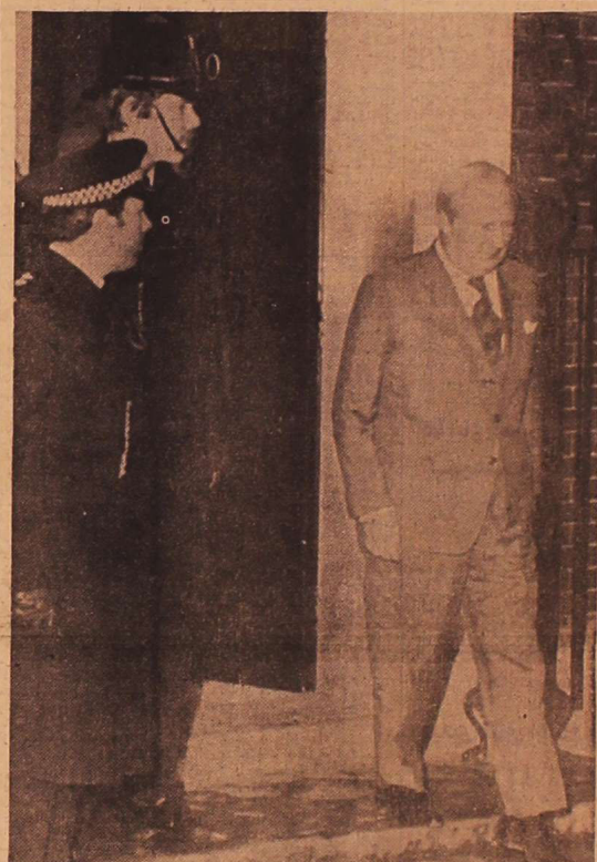
لندن (همه) - اورد هیت، نخست وزیر محافظه کار انگلستان، شماری ده خیابان ناویونگ را برای دادن گزارش انتخابات به ملکه الیزابت دوم به سوی کاخ بلیکنگ ترک می کند

ریاضی - اسوشیتد پرس - مقامات امریکایی گفتند سوریه و اسرائیل با فرستادن نمایندگان خود به مذاکره میزبانه ی واشینگتن موافقت کرده اند. این مذاکره ها حدوداً ۱۶ مارس وارد عمل خواهد شد. مقامات امریکایی در بیانیه ای اعلام کردند که سوریه و اسرائیل موافقت کرده اند تا در جریان گفتگوها نمایندگان نظامی و دیپلماتیک خود را ظرف تقریباً دو هفته به واشینگتن بفرستند تا درباره ی نخستین مرحله ی جدایی هر دو در جریان گفتگوها مذاکره کنند. آنها گفتند اما هنوز شکاف بزرگی میان دوطرف وجود دارد.