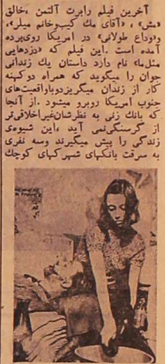
کارایی و دوول در هنر