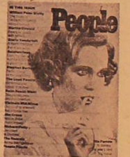
روی پهل اولین شماره «دزدها» با نکیس میانیو در «دستی پرزده»