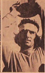
این ستاره که بدین ترتیب راهی آلمان است...