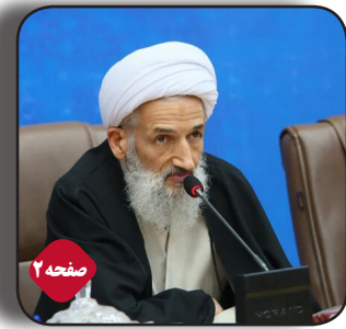
نماینده ولی فقیه در مازندران: وضعیت کمر بندی ساری نامناسب است