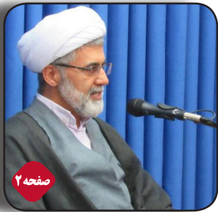
رئیس هیات نظارت بر انتخابات مازندران: گمانه زنی ها درباره رد یا تایید صلاحیت ها شایعه است