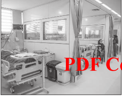
گره گشایی دولت از ابر طرح بیمارستانی مازندران