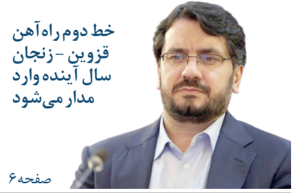
خط دوم راه آهن قزوین - زنجان سال آینده وارد مدار می‌شود