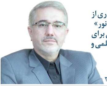
بهره‌بردار از «چشمه نور» پیشرو برای جهش علمی و فناوری