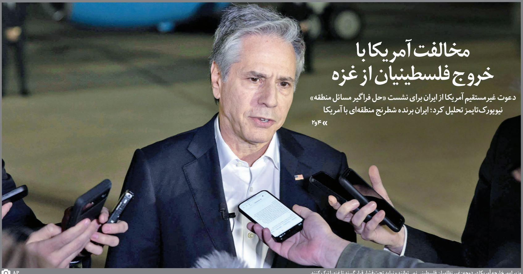
وزیر امور خارجه آمریکا در دوحه؛ غیر نظامیان فلسطینی نمی توانند نباید تحت فشار قرار گیرند تا غزه را ترک کنند

انتشار خبری درخصوص نامه اعتراضی ایران به گروه ویژه اقدام مالی (FATF)، باعث شد که رابطه ایران با این نهاد دوباره بر سر زبان ها بیفتد. اما جزئیات این نامه چه بود و چه اثری بر آینده اقتصاد ایران دارد؟ به گفته کارشناسان، ایران در این نامه خواستار