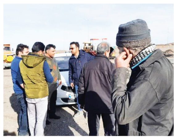
بازدید مدیر کل راه و شهرسازی استان قم از پروژه اجرایی شرکت بهیارسازه