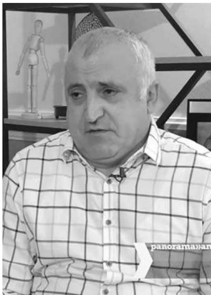
Էս ա փոխելու ընդամենը:

Գերիների ընտանիքների, հարակատների, ապրումակցող անձանց մօտ կատաճանան դրական էմօցիաներ, բայց միեւնոյնն է, այն դրագային է, եթէ դուք հարցնում էք, թէ այն ինչ ֆունդամենտալ ազդեցութիւն կունենայ, ապա՝ ֆունդամենտալ ոչ մի փոփոխութիւն մեր ժողովրդի հոգեվիճակի վրայ չի ունենալու: Գործնականում այն ինչ է փոխում մեր կամ հայրենիքի կեանքում, Արցախից բռնագաղթածների կեանքում, կամ պատերազմում գոհաճների հարագատների կեանքում՝ գրեթէ ոչինչ, գոտ դրագային լատ բան: Ասենք ամբողջ տարին մարդիկ բացասական էմօցիաներով ապրել են մի հատիկ, մի օր տնօնի ուրախանան,