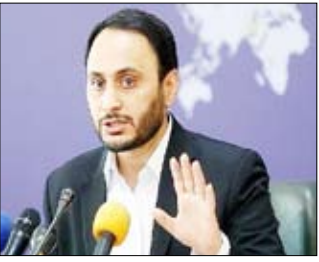
مهدی وفاقی، معاون اول رئیس‌جمهور

پیش‌بینی کاهش حدود ۱۵ درصدی تورم هم در مراجع بین‌المللی برای اقتصاد ایران تعیین شده است و ما هم در داخل پیش‌بینی شیبه به همین رابرای سال آینده داریم.