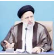
سید ابراهیم رئیسی

سید ابراهیم رئیسی در چهارمین مجمع معاونین اداری–مالی وزارتخانه‌ها، نهادها، موسسات مالی و شرکتهای دولتی گفت: رفع تبعیض در پرداخت‌ها بسیار اهمیت دارد. احساس تبعیض بدتر از خود تبعیض است. نظام عادلانه پرداخت از ضرورت‌های کشور است. ارزیابی دقیق عملکرد پرسنل اهمیت زیادی دارد. مسئولیت‌پذیری موضوع بسیار مهمی است که می‌تواند دستگاه‌ها را در اجرای مسئولیت خود کارآمد کند. به‌نظام تشویق قبل از تنبیه اعتقاد داریم. باید بین کسی که خوب کار می‌کند با کسی که کم کار می‌کند فرق گذاشت.