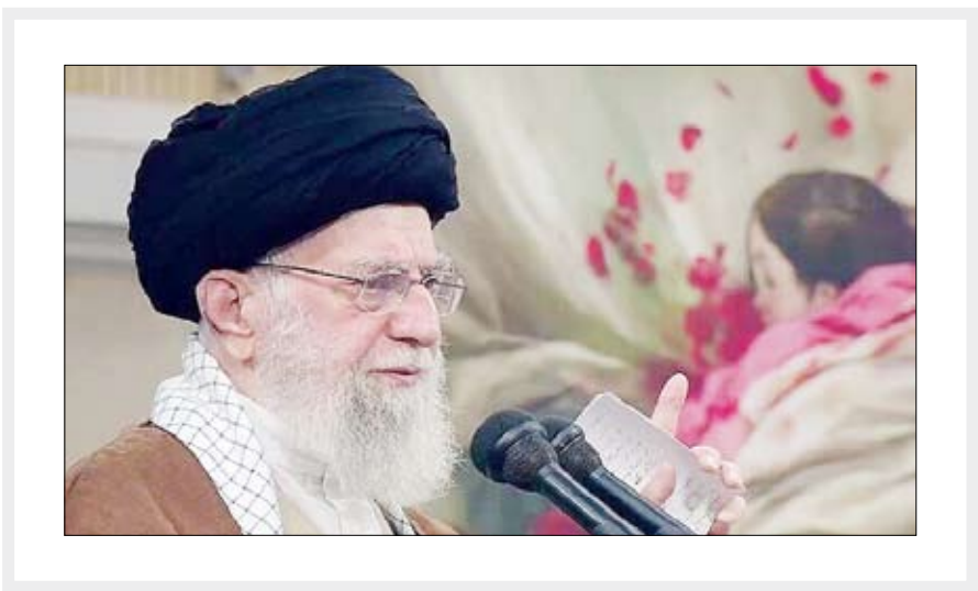
رهبر انقلاب در دیدار هزاران نفر از مردم استان قم تاکید کردند؛

رذالت باروش‌های مختلف، این سیاست را پیگیری می‌کنند. ایشان، تلاش برای کوچک‌شمردن حضور مردم در مناسبت‌های مهم را مردم‌به‌حضور، حاکمیت‌اسلامی، عزت‌اسلامی، صلاح‌کامل و اعتلای ملت و مقابله با استکبار است. ایشان معرفت‌افزایی مردم را وظیفه اندیشمندان، استادان، روشنفکران، طلاب و دیگر قشرهای موثر در افکار عمومی خواندند و گفتند: آمریکایی‌ها با ساده‌اندیشی و محاسبات غلط به همراه دلیس‌گانشان بعد از ۴۵ سال همچنان در حال توجیه چهره رژیم منحوس و وابسته‌های هستند که در ۲۲ بهمن ۵۷ با لگد ملت از این خاک پاک به بیرون رانده شد. رهبر انقلاب با بیان دخالت‌مستقیم انگلیس در روی کار آمدن رضاخان افزودند: این عنصر دست‌نشانده به کمک عوامل انگلیس بعد از چند سال شروع به استحاله فرهنگی ملت کرد که «کشف حجاب، تعطیلی حوزه‌ها و مراسم عزاداری» و اقدامات مشابه او را باید با این چشم نگاه کرد. حضرت آیت‌الله خامنه‌ای با اشاره به دخالت‌انگلیس در روی کار آمدن محمدرضا کودتای مشترک آمریکا و انگلیس برای بازگرداندن شاه فرساری به قدرت در سال ۱۳۳۲، افزودند: رژیم طاغوت اول، وسط و آخرش با کمک بیگانگان روی کار آمد و به حیات نگینش ادامه داد و در مقابل این کمک‌ها، نه تنها نفات ایران بلکه عزت و دین و شرف ملت را هم به بیگانگان فروخت اما حالا بعضی‌ها در صدد توجیه آن رژیم فاسد هستند. رهبر انقلاب اسلامی در ادامه سخنان‌شان به تبیین راهبرد جبهه استکبار و استثمار در ایران پرداختند و افزودند: آمریکا و رژیم صهیونیستی در نقطه‌مقابل راهبر دام‌برای آوردن مردم به وسط میدان و سپردن پرچم تلاش و مبارزه به آنها، سیاست کلان «بیرون کشاندن مردم ایران از صحنه» را بناکر گرفته‌اند و امروز هم در نهایت