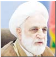
آیت‌الله علی خامنه‌ای

رئیس قوه قضاییه گفت: بدون تردید ضروری است که ما از ظرفیت‌ها و تخصص