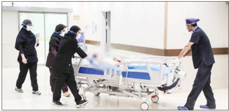
عمل بیوند قلب اهدایی مجروح حادثه تروریستی کرمان