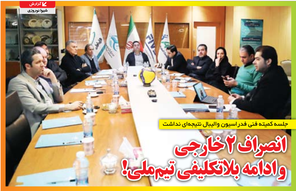
جلسه کمیته فنی فدراسیون والیبال نتیجه‌ای نداشت