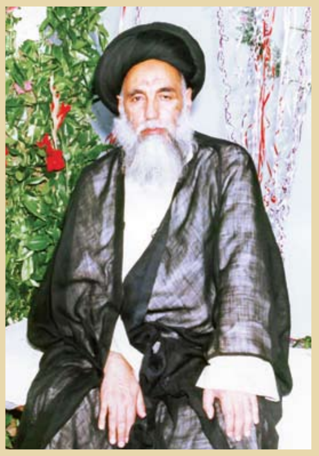
آیت‌الله سیدعلینقی طبسی حائری

آیت‌الله حاج سیدعلینقی طبسی حائری(قده)، از علمای مشهور و استادان حوزه علمیه شهر مشهد به شمار می‌رفت. وی به تاریخ هفتم مها مبارک رمضان ۱۳۴۲ق، معادل ۲۳ فروردین ۱۳۰۳ه.ش، در خاندانی اصیل، علمی و مذهبی در شهر مقدس کربلا دیده به جهان گشود. پدرش حجت‌الاسلام والمسلمین حاج سید کاظم طبسی حائری از روحانیون بانفوذ این شهر محسوب می‌شد. برادر بزرگ‌تر ایشان مرحوم آیت‌الله حاج‌سیدمحمدرضا طبسی حائری، امام جماعت حرم امام حسین(ع) بود. آیت‌الله طبسی حائری در خانواده‌ای متولد شد که حسینی و از زوار آن حضرت بودند. آنها فراوان به زیارت سیدالشهدا(ع) می‌رفتند و فرزند خود را نیز عاشق آن حضرت تربیت نمودند. آن بزرگ در چنین خانواده‌ای مؤمن و ارادتمند به اهل بیت(ع)، نشوونما یافت و روزبه‌روز بر محبت، معرفت و اخلاص نسبت به آن بزرگان افزوده می‌شد. این عشق سبب شد در اواخر عمر، نیمی از منزل خود در مشهد را وقف حسینی ه و در آنجا اقامه جماعت نماید و درس و بحث حوزوی خود را نیز به آن منتقل کند. او در زمان حیاتش، مجالس مذهبی بسیاری را در آن مکان برقرار کرد و هزاران بار، نام، فضایل و مناقب امام حسین(ع) و اولاد و اصحاب آن بزرگوار و ذکر مصیبت ایشان،