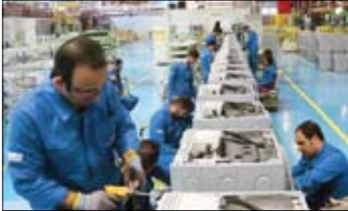
حور به ملکی