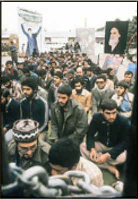
آبان ۱۳۵۸: نماز جماعت دانشجویان بیرو نظام امام در لانه جاسوسی آمریکا

«در تاریخ تحولات معاصر ایران، نقش چند دولت خارجی - از جمله دولت‌های ایالات متحده آمریکا و انگلیس - بیش از دیگران تأثیرگذار و مسئله‌ساز بوده است، بنابراین بررسی تحولات و چگونگی روابط ایران و دولت‌های مزبور، یکی از موضوعات مهم و مورد توجه می‌باشد، زیرا تأثیر این روابط در بسیاری از امور داخلی و حتی در روابط خارجی، گسترده و تعیین‌کننده بوده است. در سال‌های قبل از پیروزی انقلاب اسلامی، امکان تحقیق و تألیف در این زمینه نبود، زیرا مخالف منافع و مصالح رژیم وابسته حاکم و دولت‌های خارجی مسلط بر ایران بود، از این‌رو پس از پیروزی انقلاب اسلامی، محققان و نویسندگان از رژیم گذشته و همچنین مدارک موجود و مرتبط با موضوع در خارج از کشور، تحقیقات و تألیفات گسترده و ارزنده‌ای در این زمینه انجام دهند. در میان دولت‌های خارجی ذی‌نفوذ و تقریباً مسلط بر کشور، بیش از همه انگلیس و آمریکا ایفای نقش کرده‌اند. در سال‌های پس از کودتای ۲۸مرداد