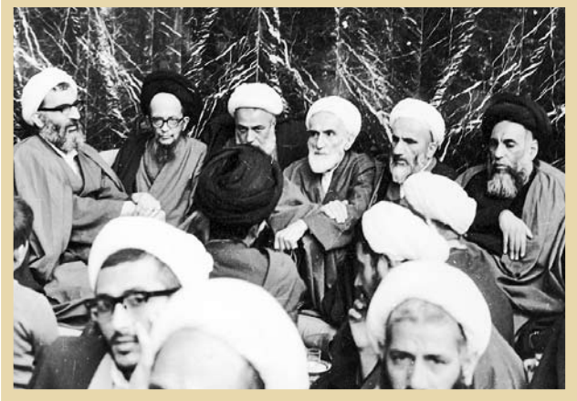
ازبهنیشت،۱۳۵۸. آیت‌الله سیدعلینقی طبسی حائری در مراسم ترحیم شهید آیت‌الله زین‌العابدین مطهری

آیت‌الله طبسی حائری دوران کودکی را تحت تربیت پدر و مادر بزرگوار خویش سپری نمود، سپس به مکتب‌خانه معروف مرحوم حاج‌شیخ‌علی‌اکبر نائینی در کربلا رفت و باقرآن آشنا شد. پس از آن دروس حوزوی را آغاز نمود. ادبیات را نزد آیت‌الله شیخ‌یوسف خراسانی، منطبق را نزد مرحوم سید کاظم بیر جندی حائری، لمعتین را نزد آیت‌الله شیخ غلامحسین تبریزی، رسائل را نزد آیت‌الله شیخ غلامحسین مرندی، مکاسب و کفایه را نزد آیت‌الله حاج‌آقا حسن طباطبایی قمی خواند و سپس حدود هشت سال در درس خارج فقه و اصول آیت‌الله‌العظمی حاج‌آقا حسین طباطبایی قمی شرکت نمود و تقریرات خارج فقه و اصول ایشان را نوشت که بخشی از آنها همچنان موجود است. امید است با همت فرزندان آن مرحوم، این آثار به چاپ رسد. همچنین در درس خود آیت‌الله‌العظمی سیدهادی خراسانی شرکت نمود و تقریراتی از درس ایشان را نیز نگاشت. آیت‌الله طبسی حائری غیر از این استادان در دروس خارج دیگر اعلام و فحول حوزه نیز شرکت نمود. اعاضلی چون آیات عظام: سیدابوالقاسم خو یی و سیدمحمد های میلانی در کربلا، آیت‌الله طبسی در دوره‌ای که در درس خارج آیت‌الله‌العظمی خو یی در