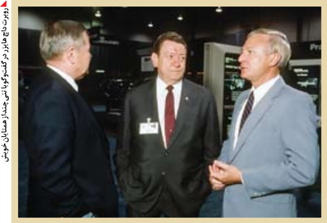
روبرت داج هایزر در گفت‌وگو با جنی‌هان همتیان خوین

شکست کودتای هایزر در واپسین ساعات حکومت رژیم پهلوی، به مثابه نمادی برای شکست کودتا‌های بعدی، تا دهه‌های متوالی بود. چه اینکه پس از پیروزی انقلاب اسلامی نیز، کودتاهایی از سوی کارفرمایان ژنرال‌ها به دیگر عناصر و جریانات سفارش داده شد که تیر همه آنها به سنگ خوردا گویانگه در این سرزمین و برای مدت‌های مدید، کودتا اثر نخواهد کرد، چراکه مردم در صحنه هستند و تا هنگامی که باشند، در هر همین باشنه خواهد خردید