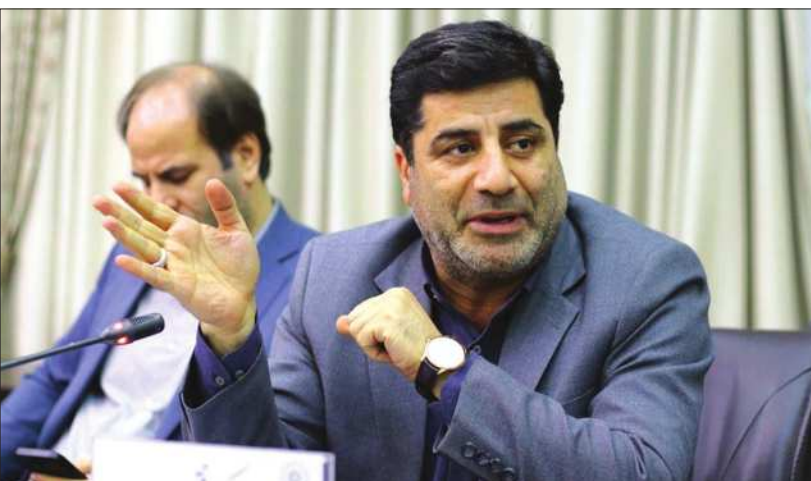
لرزم تسریع فرآیند کسب مجوز استفاده از محصولات دانش بنیان و جدید تاکید کرد و یادآور شد: این فرآیند باید توسط معاونت علمی و فناوری ریاست جمهوری تسریع شود و از کسانی که مجوز استفاده