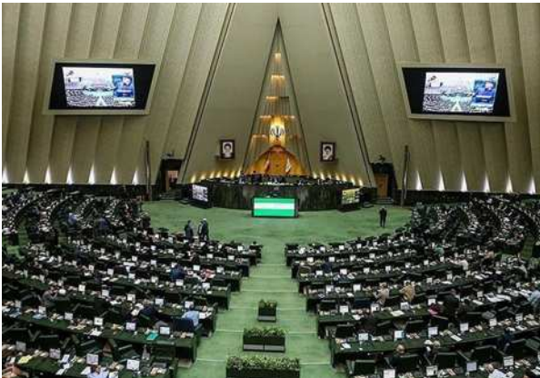
نمایندگان مجلس شورای اسلامی در نشست علنی دوشنبه (۱۸ دی)

مجلس در روند بررسی گزارش کمیسیون اقتصادی در مورد طرح اصلاح ماده (۱) قانون تسهیل تکالیف مؤدیان جهت اجرای قانون پایانه های فروشگاهی و سامانه مؤدیان با کلیات آن موافقت کردند.