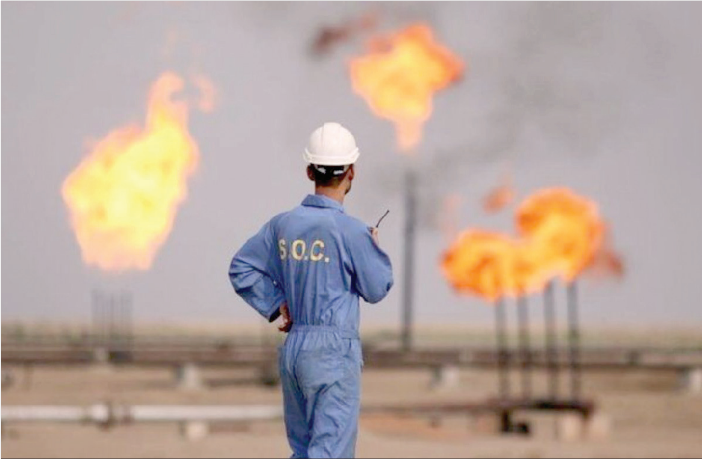
جمع‌آوری گازهای همراه نفت در استان خوزستان