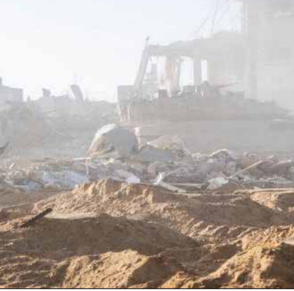
یک سرباز اسرائیلی در نزدیکی محاصره راهبردی در غزه، ۲۰۰۸

به یک تهدید تاکتیکی تقلیل می‌دادیم. فقدان رهبری و کوته فکری تصمیم گیران منجر به تصمیم مستمر برای عدم اقدام شد و امکان تجمع تقریباً بدون وقفه نیروهای نظامی قابل توجه را فراهم کرد. تنها می‌توان این را یک حماقت اسرائیلی نام گذاشت. به جای اقدام پیشگیرانه، این تیز را پذیرفتیم که موازنه وحشت در مقابل حزب الله در نهایت منجر به "زنگ زدگی" انبار موشکی آنها می‌شود و بنابراین نیازی به اقدامات پیشگیرانه و پرداخت هزینه نیست.