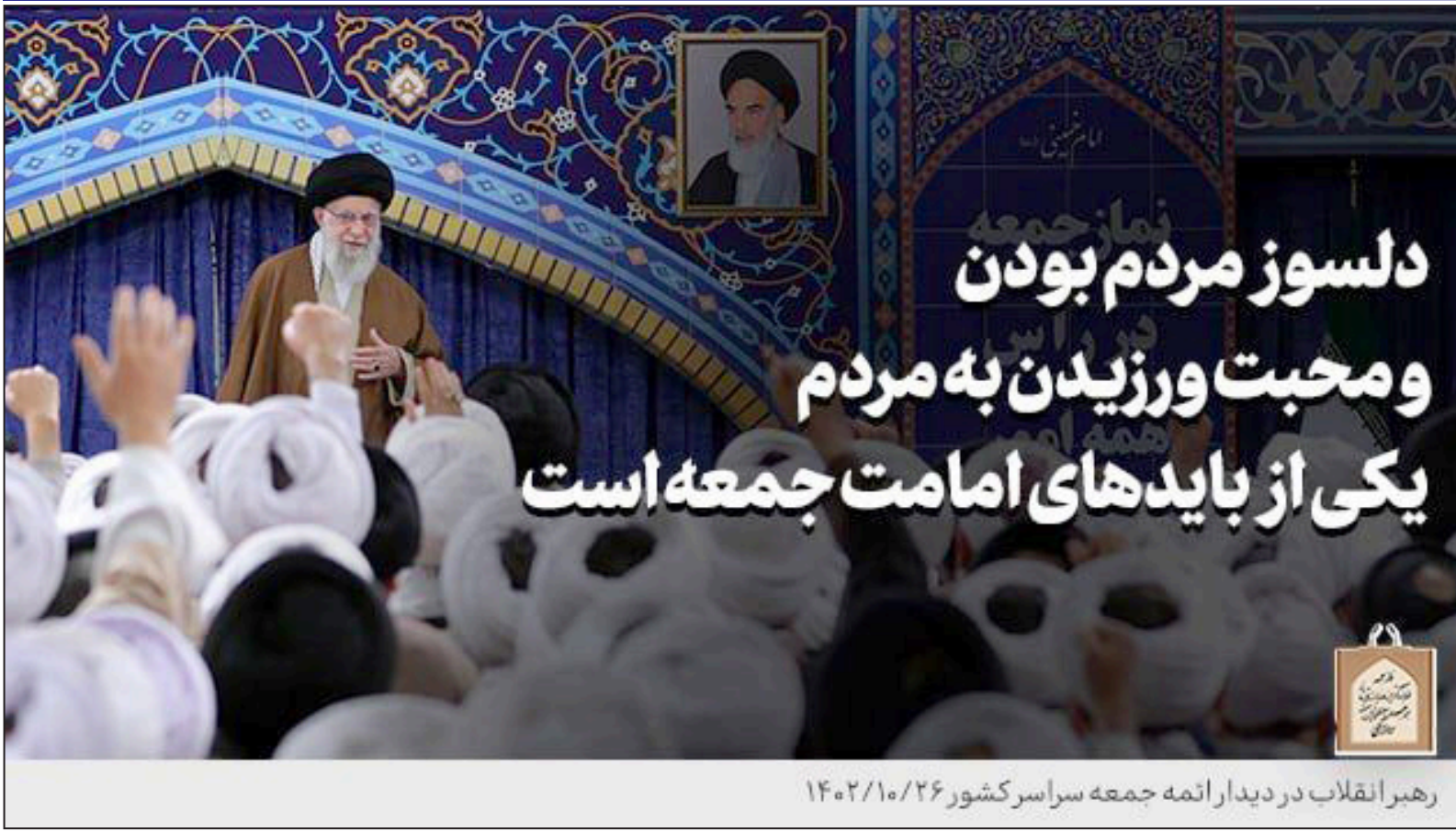
رهبر انقلاب در دیدار ائمه جمعه سراسر کشور ۱۴۰۲/۱۰/۲۶