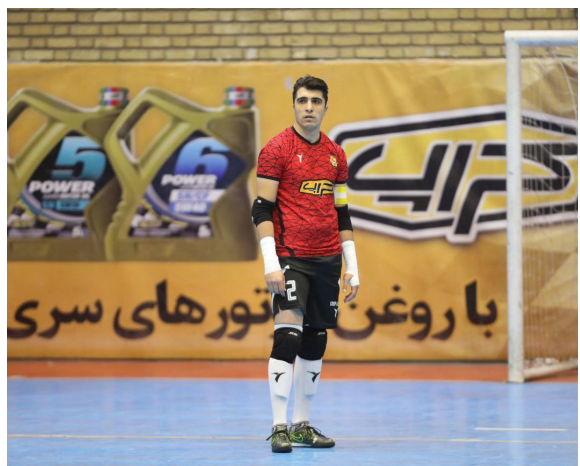
شماره یک تیم ملی در جام ملت های آسیا خواهد بود و ماموریت نیمه تمام را به پایان می رسانم.

چرایی نتایج ضعیف کراپ الوند در نیم فصل اول نتایج کراپ در دور رفت به دو دسته تقسیم می شود. حقیقتا اوایل لیگ افتضاح بودیم و دلیل آن