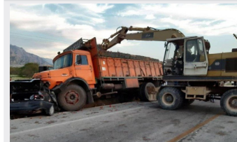
حرکت با دنده عقب، یک نفر را به کشتن داد

سؤال اینجاست که امروز و برای ارتقاء سطح تعلق اجتماعی در بستر جامعه و در میان عموم مردم که از بدبختی ترین شاخص های سرمایه اجتماعی است، چه راهکارهایی باید پیش بینی شود و سهم دستگاه ها و نهادهای فرهنگی برای تقویت و نهادینه کردن آن چقدر است؟ چرا که یکی از مهم ترین پیامدهای آن در جامعه پر رنگ شدن میزان مشارکت مردمی در جهت کاستن از مشکلات و آسیب های اجتماعی است. بدبختی است به هر میزان احساس تعلق اجتماعی در میان مردم در تناسب با یکدیگر بالاتر باشد به همان میزان سهم مشارکت و همیاری مردم در رویارویی با مشکلات برای رفع آن و داشتن جامعه ای امن تر بیشتر خواهد بود.