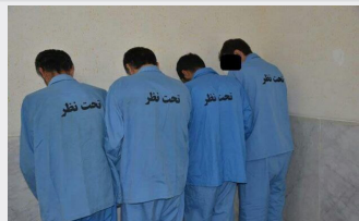
قلع و قمع سارقان در طرح ضربتی پلیس قزوین

قزوین- به گفته رییس پلیس راه استان حرکت با دنده عقب خودروی پراید و برخورد با کامیون یک کشته و سه مجروح برجای گذاشت. سرهنگ فرهاد ذاکری منش با بیان اینکه، راننده این خودرو که تمامی سرنشینان آن از اتبلاع بیگانه بودند در لاین شمالی کیلومتر ۲۴ آزادراه قزوین - کرج، حوالی شهرک صنعتی کاسپین اقدام به حرکت با دنده عقب کرد. وی افزود: حرکت راننده خاطی در نهایت منجر به برخورد پراید با یک کامیون در حال حرکت شد و در این حادثه یکی از سرنشینان سواری پراید در دم فوت و سه سرنشین دیگر نیز مجروح شدند. این مسئول اضافه کرد: کارشناسان پلیس راه، علت این حادثه را تخطی از قوانین رانندگی توسط راننده پراید اعلام کردند.