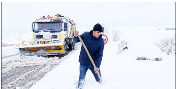
بازگشایی جاده های تبریز بعد از بارش برف

آیین نامه اخلاق حرفه‌ای «تجارت» را در سایت روزنامه ببینید.