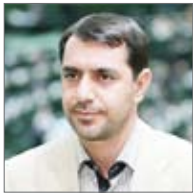
مدیرعامل صندوق بازنشستگی

کف حقوق کارکنان دولت ۱۰ میلیون تومان می‌شود