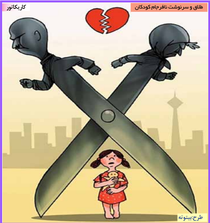
طلاق و سر نوشت نافر جام کودکان