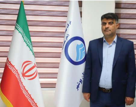
مدیر کل راهداری و حمل و نقل جاده ای استان مازندران خبر داد:

کنیم که آب آلوده نشه ؟ " شش سوال طراحی شده برای مسابقه دانش آموزی " آب یاران فردا " است. وی اضافه کرد : دانش آموزان می‌توانند در قالب این مسابقه پاسخ‌های خود را، از طریق بازی فکری ، ربات ، مدل سازی ، هوشمندسازی ، لوگو سازی ، اپلیکیشن و نانو فناوری ارائه کنند .مدیرعامل شرکت آب و فاضلاب استان بوشهر گفت : رویداد علمی ، ترویجی و رقابتی " آب یاران فردا " با رویکرد افزایش سواد آبی دانش آموزان طراحی شده است. عالی بیان کرد: در این رویداد ، دانش آموزان تشویق به درک بیشتر آب و محدودیت منابع آبی می‌شوند تا از این آب در دسترس ، بهترین استفاده برای انسان و طبیعت انجام شود.