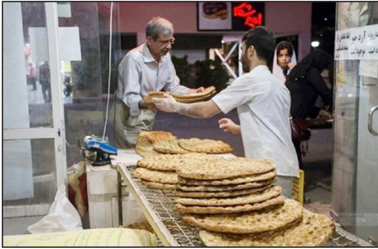
مشاور وزیر اقتصاد با تأیید تعیین میزان مصرف متعارف نان توسط سامانه هوشمند در پهنه کشوری گفت: برخی هیاهوهای اخیر از طرف معدود نانوائی هایی است که تخلف می کنند و فروش نامتعارف دارند که سهمیه آرد آنها کم شده است.

به مردم نداریم این نظام های پر دازشی را آورده ایم داخل سامانه. اغلب نانوائیان این گونه رفتار می کنند که عرضه نان را به شکل عادی به مردم انجام می دهند، این پردازش ها صرفاً برای شناخت افرادی است که احیاناً انگیزه تقلب یا تخلف دارند، بعد از پردازش آن تراکنش هایی که از نظر سامانه پذیرفته شده است به معادل آرد تبدیل می شود و برای دوره آتی اختصاص پیدا می کند.