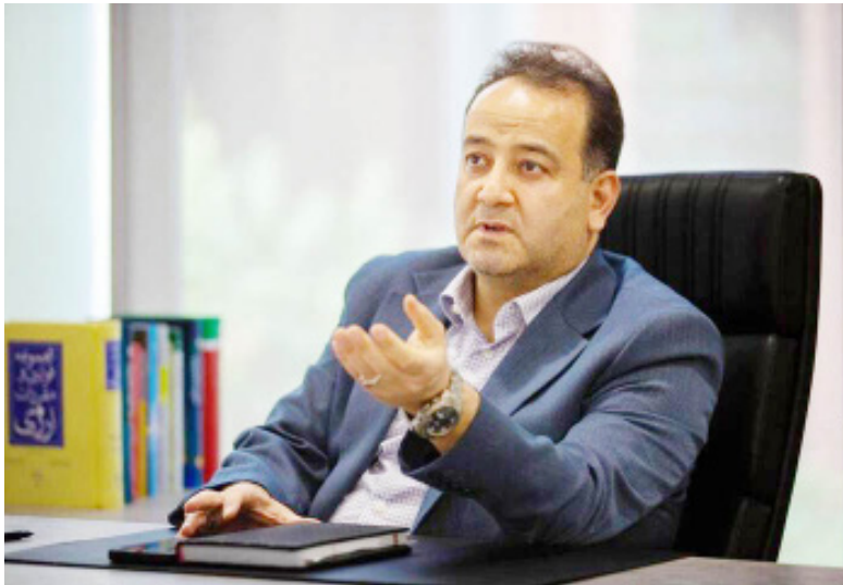
به گفته سنگنوی مرکز مبادله ارز و طلا، مخالفت با عرضه طلا در مرکز مبادله از سوی کسانی که در فرآیند قاچاق یا فروش مجدد این شمش ها در کشور دخیل بودند، صورت می گیرد، در حالی که صادرکنندگان که واقعا به دنبال رفع تعهد ارزی بودند، از این امکان استقبال کردند.