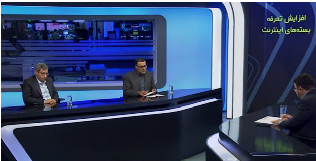
نظر گرفته شده است.

او گفت: الان ۱۵ سال و حتی بیشتر است که اپراتورها پروانه دارند و آن چیزی که در پروانه آنها بوده را به دقت بررسی کرده‌ایم و تا الان هم هر آنچه که تعهد داشتند را تقریباً با دقت بالایی انجام دادند؛ اگر هم گاهی اوقات تعهدات اتفاق نیفتاده ما برخورد قانونی کرده‌ایم و جریمه هم شده‌اند. روحانی نژاد تصریح کرد: افزایش تعرفه اینترنت دلایل مختلفی دارد؛ طبیعتاً ما تورم داشتیم و قیمت اینترنت باید افزایش پیدا می‌کرد اما سازمان مقررات رادیویی جزء معدود دستگاه‌های حاکمیتی است که تعهد گرفته که در ازای افزایش تعرفه افزایش خدمات هم داشته باشد.