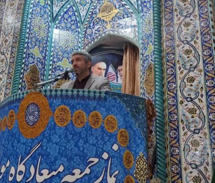
معاون وزیر رفاه مطرح کرد:

وی در تشریح برگزاری مانورها افزود: در این مانورها شخص شماره یک میدان، فرماندار هر شهرستان از وقوع حادثه خبردار شده و به سرعت جلسه