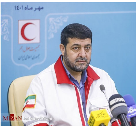
مهر ماه ۱۴۰۱

نیز انجام شده است. امروز ضرورت دارد تا کمک‌های بشردوستانه هرچه سریع‌تر به دست مردم غزه برسد و همکاری در این زمینه حائز اهمیت است. رئیس جمعیت هلال احمر کشورمان همچنین به راهپیمایی اربعین اشاره کرد و گفت: در مراسم ارسال مسالمت‌آمیز بودیم که هم افزایش و همکاری چه نتایج مثبتی در پی داشت و این روند باید میان جمعیت‌های ملی تداوم یابد.