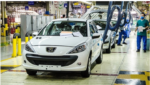
موضوع نداده است.

خودرو راناپلاس هم مشمول این تبدیل اجباری شده است و افرادی که سال گذشته برای خرید راناپلاس ثبت‌نام کرده‌اند اکنون مجبورند خودروی راناپلاس ارتقا یافته را دریافت کنند و ۱۰۰ میلیون تومان بیشتر به حساب شرکت واریز کنند.