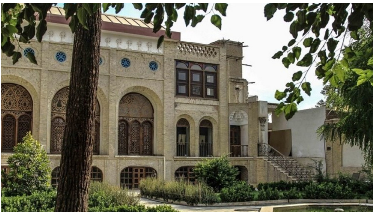
شود. به طوری که احتمالاً این عمارت تبدیل به مجموعه‌ای فرهنگی با عملکرد چندگانه می‌شود.

تبدیل به موزه بشود، موزه‌آرایی انجام می‌شود و اگر قرار باشد تبدیل به فضای دیگری بشود باید اقدامات لازم برای بازنده‌سازی و تکمیل تجهیزات عمارت وثوق‌الدوله انجام بگیرد.