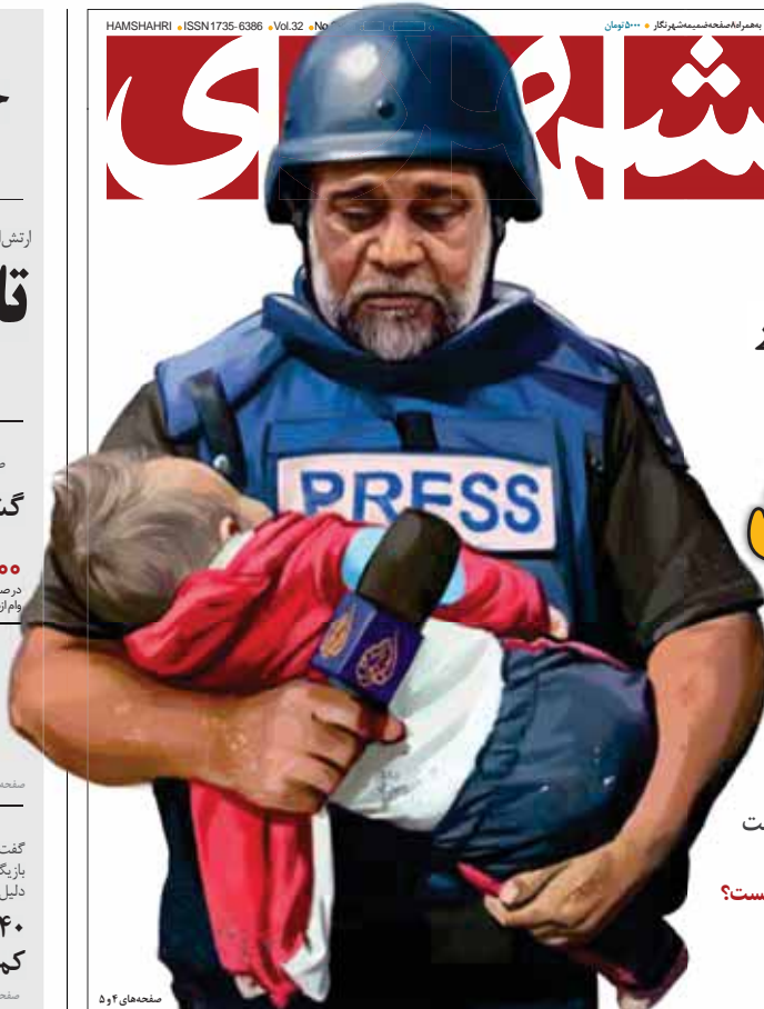
صفحه‌های ۴ و ۵

بازداشت ۳۵ نفر از عوامل پشتیبانی تروپست‌های انتحاری کرمان جزئیات تازه از نقشه ترور پست‌ها