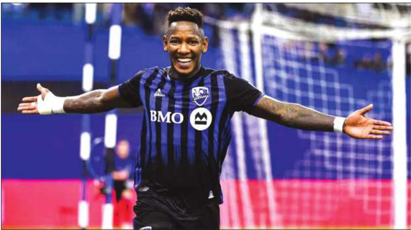
ویدا در لیگ برتر هندوراس و ویسوا کراکوف در لهستان را بر تن کرده است.

کیوتو در لیگ برتر آمریکا (MLS) که از لیگ‌های مشهور دنیاست و ستاره‌های زیادی را در خود جای داده، ۴۸ بار موفق به گلزنی شده و ۳۱ پاس گل نیز ارسال کرده است. این بازیکن در تیم مونترال شاگرد تیری آنری بوده و در زمان حضور این سرمربی، ۲۵ بازی برای تیمش انجام داده است. فصل ۲۰۲۲ - ۲۰۲۱ یکی از بهترین سال‌های دوران ورزشی کیوتو بوده؛ به طوری که این مهاجم در ۳۶ دیدار ۱۵ مرتبه موفق به گلزنی شده بود. همچنین ششده می‌شود باشگاه تراکتور به صورت موازی به دو مهاجم دیگر در حال مذاکره است تا در صورت عدم تأیید پزشکی رومل، جایگزین وی شوند.