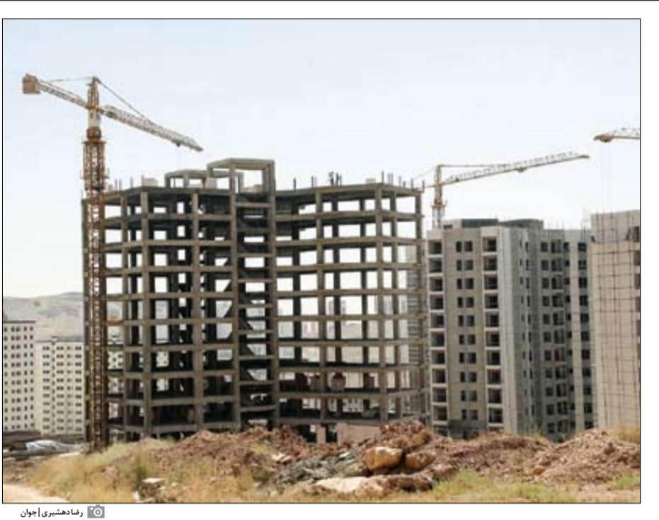
رماندهسبوری | جوان

دولت با کاهش قدرت تسهیلات‌دهی بانک‌های متخلف خصوصی، اعتبارات را به سمت ساخت و ساز مسکن هدایت کند