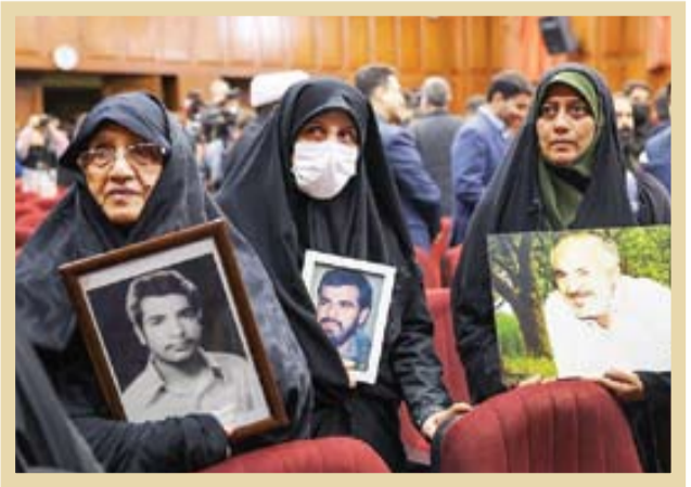
۱۳۶۰، زمانی که دادگاه منافقین

قطعا ریشه اقدامات منافقین، به آموزه‌ها و ایدئولوژی آنها مرتبط است. سازمان منافقین اساساً کارش را با مطالعات وسیع در حوزه‌های مختلف اجتماعی و عقیدتی شروع کرد. پس از حدود دهه که در این زمینه بررسی‌هایی داشتند، نهایتاً به این نتیجه رسیدند به جای مبارزه با رژیم شاه به عنوان یکی از دست‌نشان‌گان امپریالیسم امریکا در منطقه خاورمیانه، در حقیقت باید مبارزه با