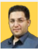
وجدعظیمینا دبیر گروه اقتصاد

پرداخت تسهیلات از سوی بانک‌ها محرک نقدینگی به‌شمار می‌رود و در صورت مدیریت مؤثر، افزایش نقدینگی می‌تواند منجر به رشد اقتصادی شود، در غیر این صورت، رکود تورم را در پی خواهد