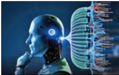
استاد هوش مصنوعی و روباتیک در گفت‌وگو با «جوان»: