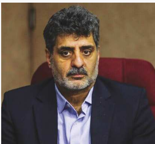
محسوس در روزهای گذشته به مشکلی برخوردیم و هیچ کمبودی در زمینه توزیع سوخت وجود ندارد.