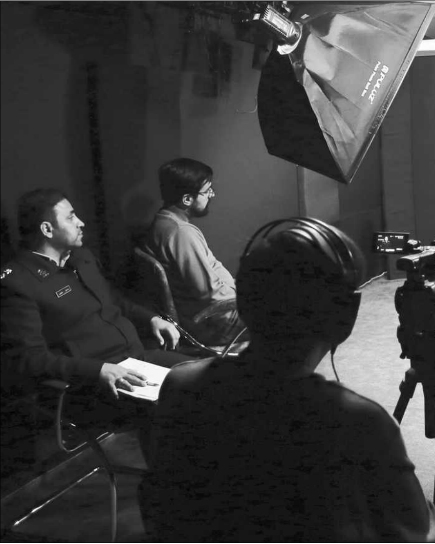
یک روز در یک استودیو فیلمبرداری

هانی هاتوان فعالیت در فضای مجازی را بسیار پس می‌دهند.