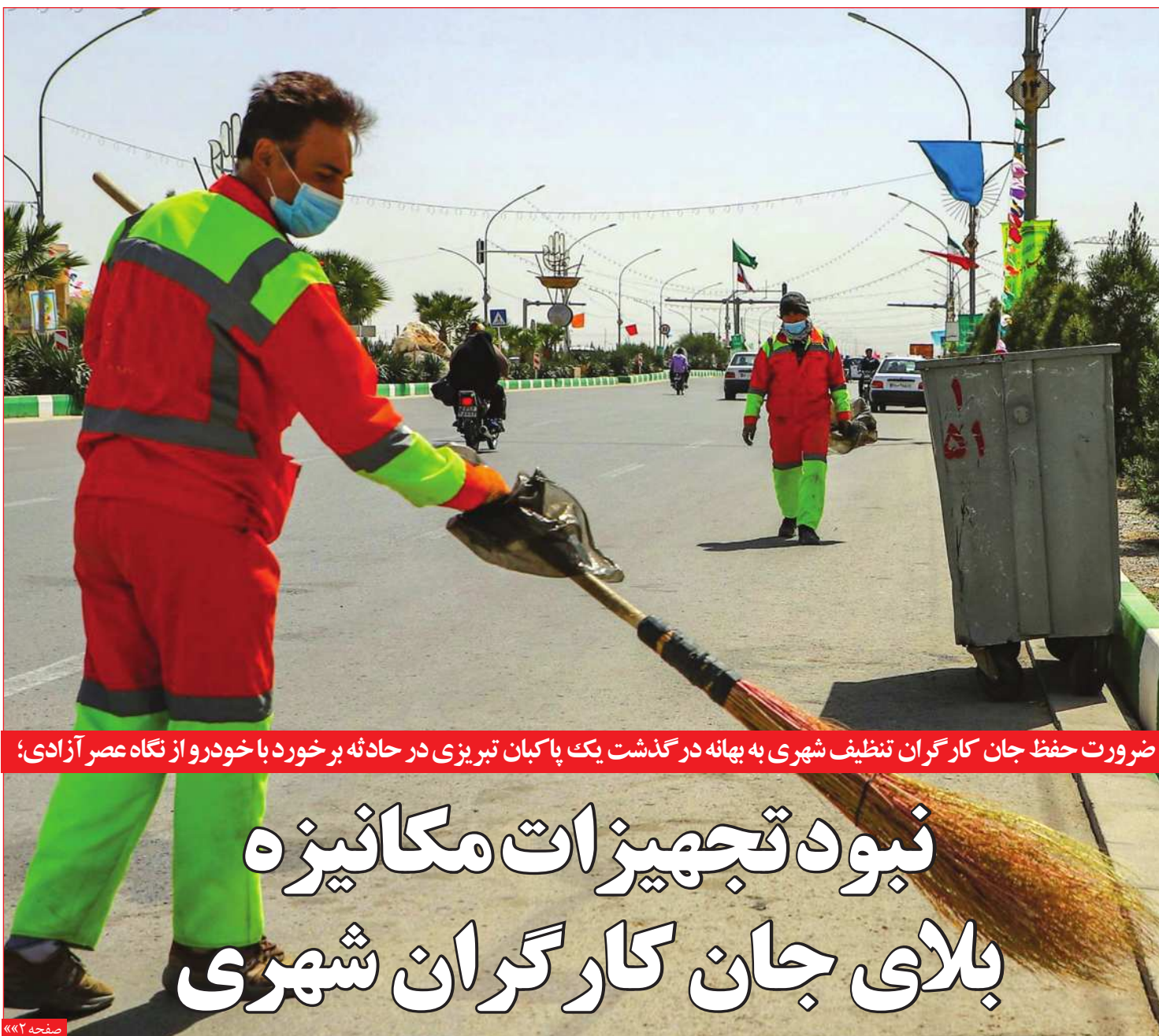
ضرورت حفظ جان کارگران نظیف شهری به بهانه در گذشت یک پاکبان تبریزی در حادثه برخورد با خودرو از نگاه عصر آزادی؛