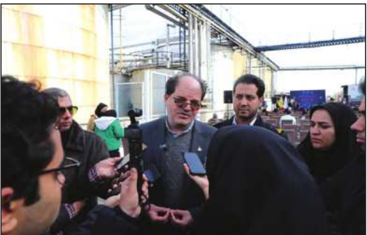
مدیرعامل شرکت گاز استان خراسان رضوی با بیان اینکه ایده، هر خانه یک اتاق گرم در سال گذشته، موفقیت‌آمیز بود، تبدیل ایده به

مدیرعامل شرکت گاز استان خراسان رضوی ضمن اشاره به مصوبه دولت مبنی بر پاداش صرفه‌جویی و کاهش قیمت مصرف قبوض تا حد رایگان، پوشش خراسان رضوی را در استمرار این مصوبه و با نیت تشویق مردم به استفاده بهینه از این سرمایه خدادادی دانست.