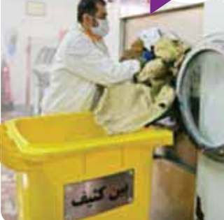
کلیس: مشغول به شستشو و اتو کشی

ساعت ۱۰ جمع آوری و تعویض ملحفه ها و لباس های تمام می شود و محموله های آماده شستشو به محوطه بیرونی بیمارستان جایی که نیز (لاندری گرفته شده است لاندری روم محل شستشو، خشک کردن و اتو کشی لباس هاست) یا همان زختموخفه قرار دارد، می رسند.