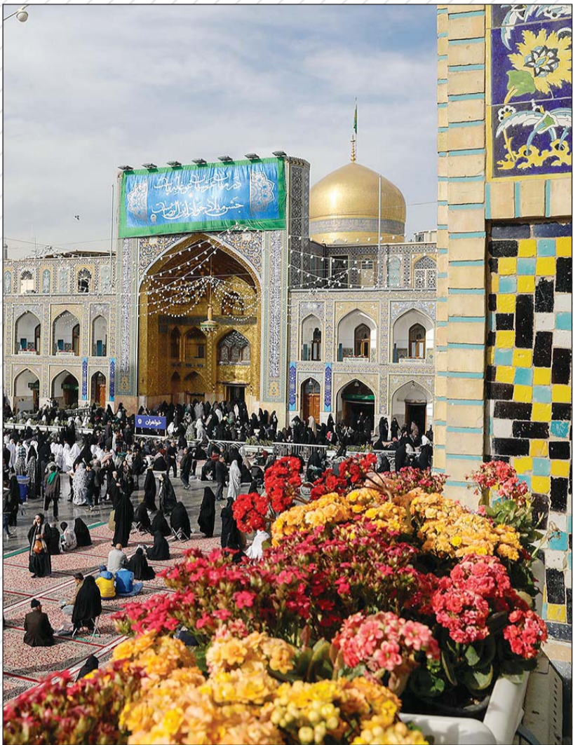
مشهد الرضا (ع)، مسرور جشن میلاد ابن الرضا (ع)