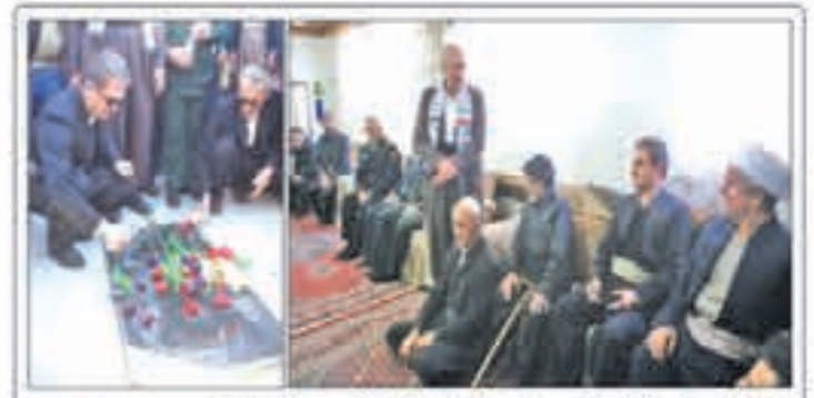
دیدار با خانواده شهیدان «کاسوندی»

شنبه ۳۰ دی / ۸ رجب ۱۴۳۵ / ۲۰ ژانویه ۲۰۲۴ / شماره ۱۳۶۳ / سال بیست و نهم / ۸ صفحه / ۳۰۰۰۰ ریال / نشانی الکترونیکی: Govarisirwan@gmail.com / سروان در فضای مجازی: @Sirwan_weekly