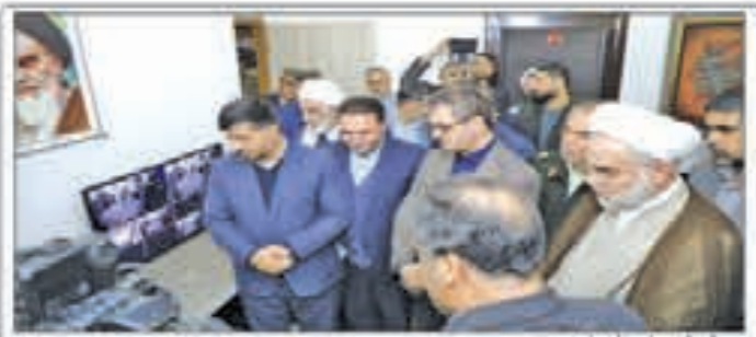
با حضور استاندار الفتاح ۱۰ کانال رادیویی و تلویزیونی ویژه انتخابات با نهمین انتخابات به طور مساوی از امکانات تبلیغاتی بهره‌مند می‌شوند