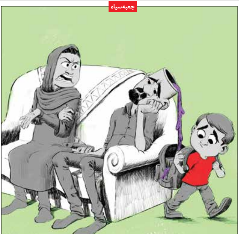
والدین متهم ردیف اول اضطراب کودکان / طرح سعید شعبانی / اصفهان امروز