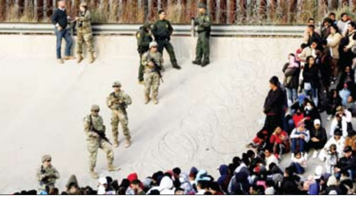
قاب روز بحران پناهجویان در آمریکا

مدیرعامل سازمان مدیریت پسماند شهرداری تهران از شکل‌گیری اقتصاد ۳۰۰۰ میلیارد تومانی در حوزه تفکیک غیر مجاز پسماند در شهر تهران خبر داد. به گزارش ایسنا، محمدی در آئین امضاء تفاهنامه همکاری در حوزه مقابله با زباله گردی و پیشگیری از بکارگیری کودکان کار میان وزارت دادگستری و سازمان مدیریت پسماند، گفت: امروز بستن لازم در حوزه خدمات شهری در ابعاد رفت و روپ و تفکیک زباله از مبدأ آماده شده است و می‌توانیم این موضوعات را خبری کنیم و از صاحب رسانه