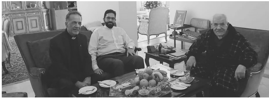
Մարգսեան Հայրը ջերմորեն ողջունել ու գնահատել է նրանց ազնի վերաբերմունքը և յոյս յայտնել, որ

Ազգային առաջնորդարանի Հանրային կապի գրասենյակից տեղեկանում ենք, որ չորեքշաբթի, յունիսի 3-ին, Թեհրանի հայոց թեմի առաջնորդ Ս. Մեսրոպ արք. Մարգսեանին այցելել էր Հայ Առետարանական եկեղեցու հոգևոր հովիտ Վերապատելի դոկտ Միշել Աղամյանը, ում ընկերակցում էր Վեր. Մերգի Շահվերդյանը: