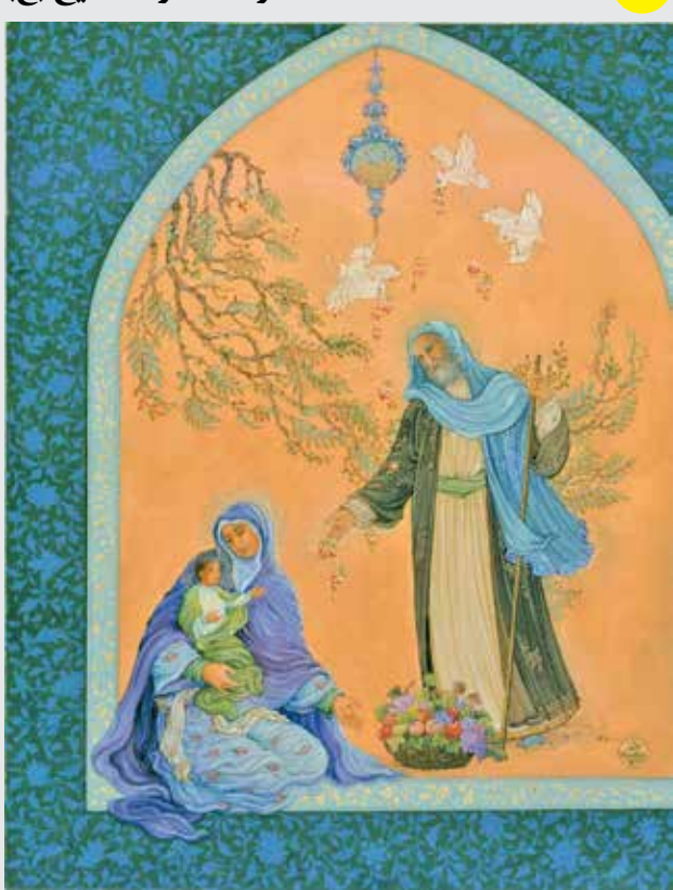
تولد حضرت مسیح (ع) رضا پدرا السماء / نقاش و نگارگر