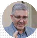
داوود متظور رئیس سازمان برنامه و بودجه

وزیر بهداشت، درمان و آموزش پزشکی با بیان اینکه ۷ هزار تخت بیمارستانی آماده بهره‌برداری در ماه‌های آینده است، گفت: در ۲ سال گذشته حدود ۲ هزار خانه بهداشت افتتاح شده است و ۲ هزار خانه بهداشت دیگر نیز آماده افتتاح داریم.