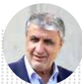
محمد اسلامی رئیس سازمان انرژی اتمی

وزیر فرهنگ و ارشاد اسلامی از رونمایی سلفونی حاج قاسم در هفته آینده خبر داد و گفت: ما به وعده‌ای که به همه علاقه‌مندان حوزه موسیقی داده بودیم که برای چنین مناسبت‌هایی با تولیدات فاخر، ملی و مذهبی بتوانیم جریان موسیقی کشور را همراه کنیم، جامه عمل پوشانده‌ایم.