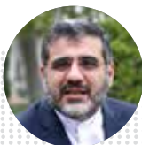
محمد مهدی اسماعیلی وزیر فرهنگ و ارشاد اسلامی