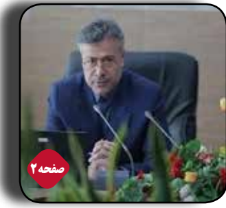
فعالین اقتصادی استان برای دریافت شناسه یکتا اقدام نمایند