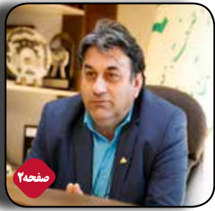
وضعیت اقتصاد ایران می تواند به رشد قابل توجه ای برسد