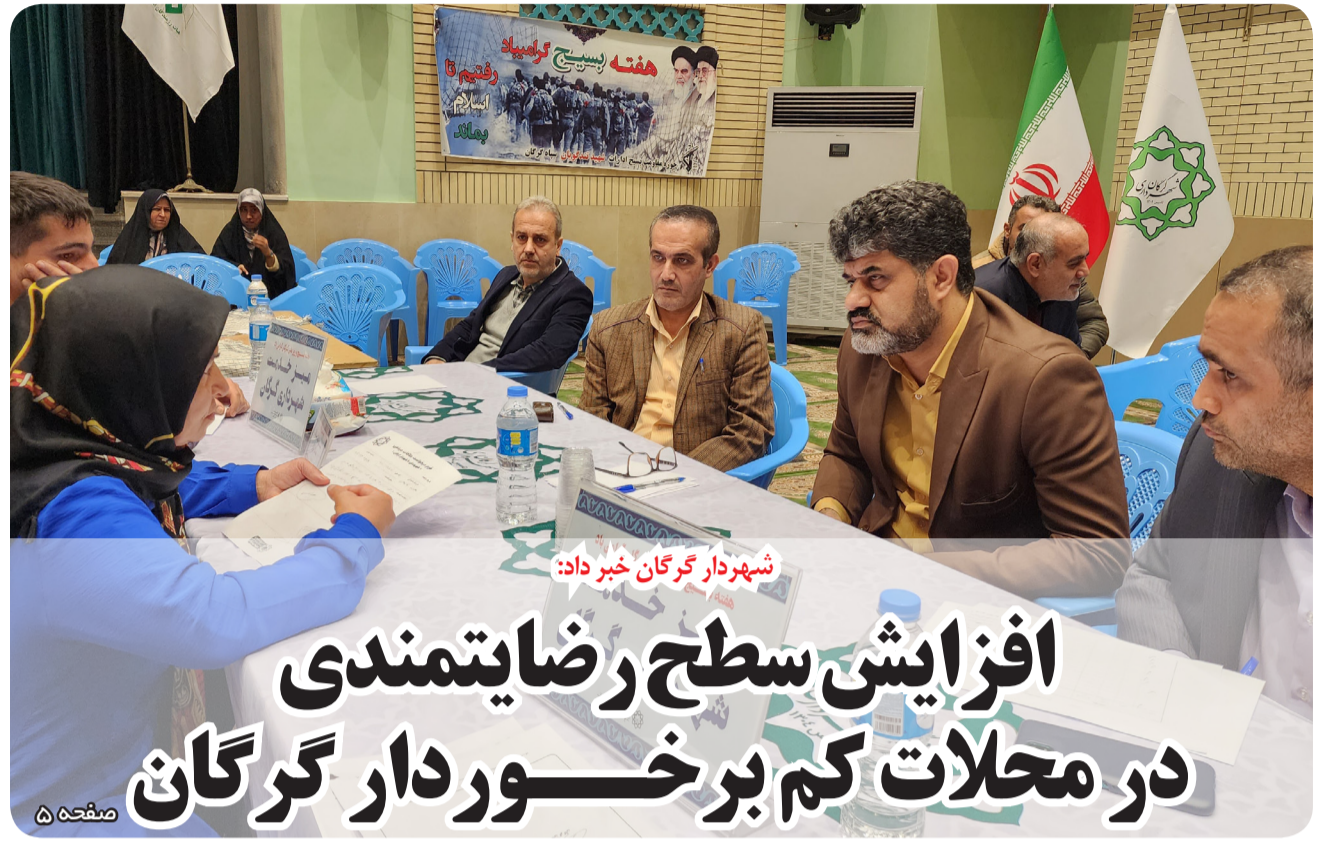
شهردار گرگان خبر داد: