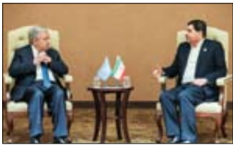
معاون اول رئیس جمهور در دیدار با دبیرکل سازمان ملل:

روزنامه سیاسی، اجتماعی و فرهنگی صبح ایران یکشنبه اول بهمن ۱۴۰۲ - ۹ رجب ۱۴۴۵ سال بیست و پنجم - شماره ۶۹۵۳ - ۱۶ صفحه قیمت: ۳۰۰۰ تومان