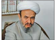
پدیرش «اناشجو-طلبه» در دانشگاه آزاد اسلامی

وی ادامه داد: مطابق با ماده ۴۱ آیین نامه اجرایی قانون نظام مهندسی و کنترل ساختمان دارندگان مدرک تحصیلی کارشناسی و بالاتر در هر یک از رشته‌های اصلی یا رشته‌های مرتبط می‌توانند از طریق تقاضای صدور پروانه اشتغال به کار مهندسی یا توجه به مدارک تحصیلی و سوابق کار و تجربه در یک یا چند زمینه خدمات مهندسی از طریق طراحی، محاسبه، نظارت، اجرای بهره‌بردار، نگهداری، کنترل و بازرسی امور آزمایشگاهی، مدیریت ساخت و تولید، نصب، آموزش و تحقیق، درخواست تشخیص صلاحیت کنند.