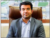
مشکلات شهری نجف آباد هوشمند مرتفع می شود

به مرکز ۱۳۷ ارسال نمایند. حیدری در پایان گفت: نرم افزار چشم شهروند شهرداری نجف آباد با درون بردن سرفصل های ورودی و ثبت درخواست در حوزه های مختلفی نظیر جمع آوری پسماند شهری، مشکلات اسفالت معابر و محلات، آب گرفتگی ها، تخلیه های ساختمانی، جمع آوری حیوانات افروخته چشم شهروند یکی از راه های ارتباطی شهروندان بومستان شهری، سرویس های بهداشتی، فضای سبز شهری، دیگر، این بستر را برای شهروندان در پنج منطقه شهری فراهم می کند تا با ارسال عکس و فیلم از مشکلات محل سکونت خود یا مناطق شهری، نسبت به ثبت درخواست و پیگیری های بعدی در یافت خدمات مورد نیاز اقدام کنند.