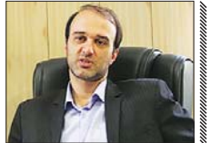
صردور ۱۰۵۸ پروانه اشتغال به کار مهندسی

رئیس اداره نظام مهندسی و مقررات ملی و کنترل ساختمان راه و شهرسازی استان اصفهان گفت: از ابتدای سال جاری تا کنون تعداد هزار و ۵۸ پروانه اشتغال به کار جدید صادر شده و تعداد صلاحیت جدید تمدید و ارتقا یافته از بیش از سه هزار و ۸۰۰ مورد بوده است.