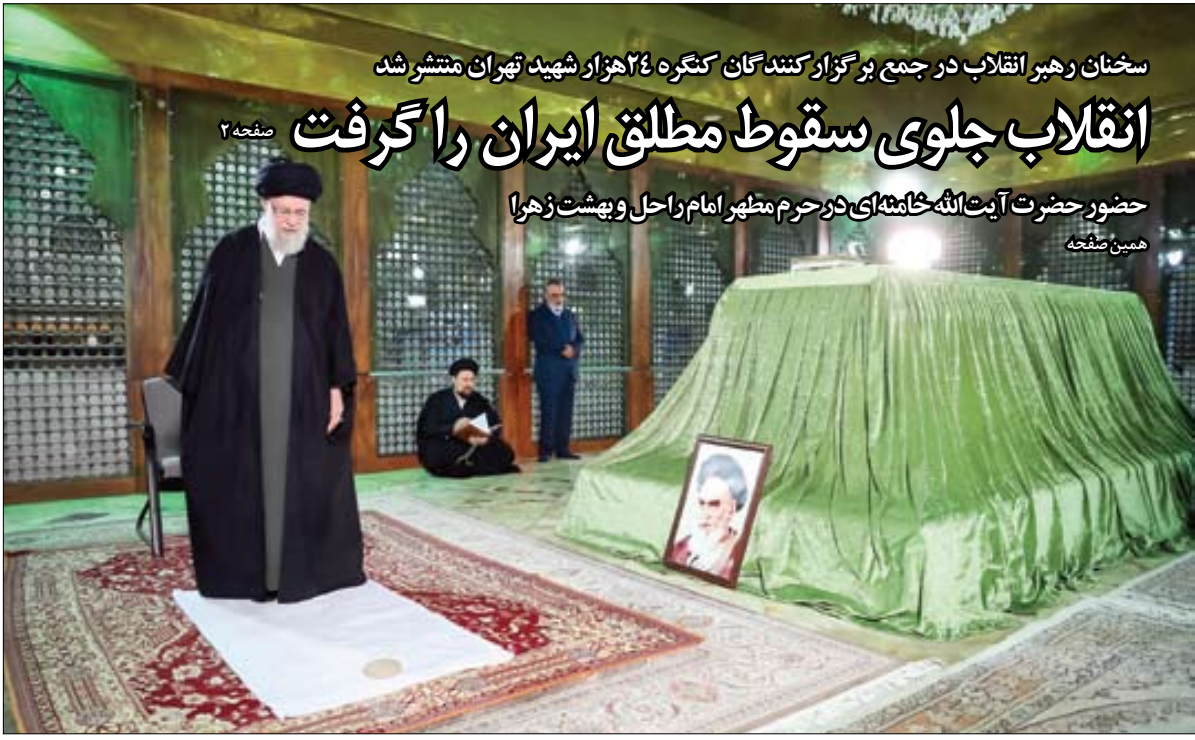
سخنان رهبر انقلاب در جمع برگزار کنندگان کنگره ۴ هزار شهید تهران منتشر شد

ویلیام برنز: کلید امنیت منطقه «معامله با ایران» است. بحران خاورمیانه ایران را «جسور تر» کرده و به نظر می‌رسد حتی آماده است تا آخرین نیابتی منطقه‌ای خود بچنگد، در حالی که برنامه هسته‌ای خود را گسترش داده است | همین صفحه