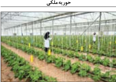
حور به ملکنی