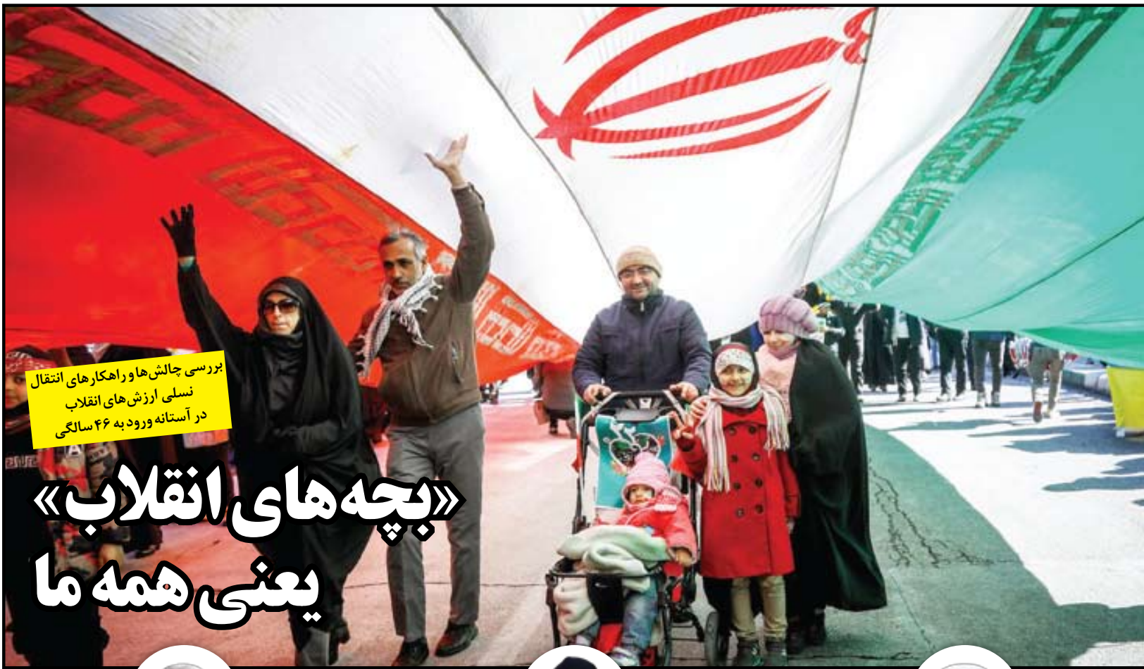
بررسی چالش‌ها و راهکارهای انتقال نسلی ارزش‌های انقلاب در آستانه ورود به ۴۶ سالگی