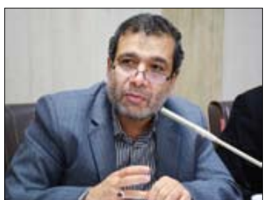
دکتر عیاضعلی رهبر

انتقال بین‌نسلی مفاهیم و ارزش‌های انقلاب مواجه با یک نظام شناختی است. در واقع ما در یک مثلث شناختی بسیار مهم میان ایده، واقعیت و تجربه قرار داریم. انقلابی به نام انقلاب اسلامی شکل می‌گیرد که منادی نشان داده است، لذا ما باید بتوانیم نسبت مناسبی بین تجربه و ایده‌ها با مینتجیگری واقعیت‌ها داشته باشیم. ما نباید رابطه بین ایده و واقعیت و تجربه را فراموش کنیم. در طول ۴۰ و اندی سال تجارب مختلفی داشتیم و مفاهیم و ارزش‌های انقلاب در زمینه‌های مختلف دچار ریش‌هایی مثل جهاد و فرهنگ جهادی بین جوانان و نوجوانان وجود دارد، اما برتری‌های ما داریم که در فاصله نسلی خود را نشان می‌دهد.