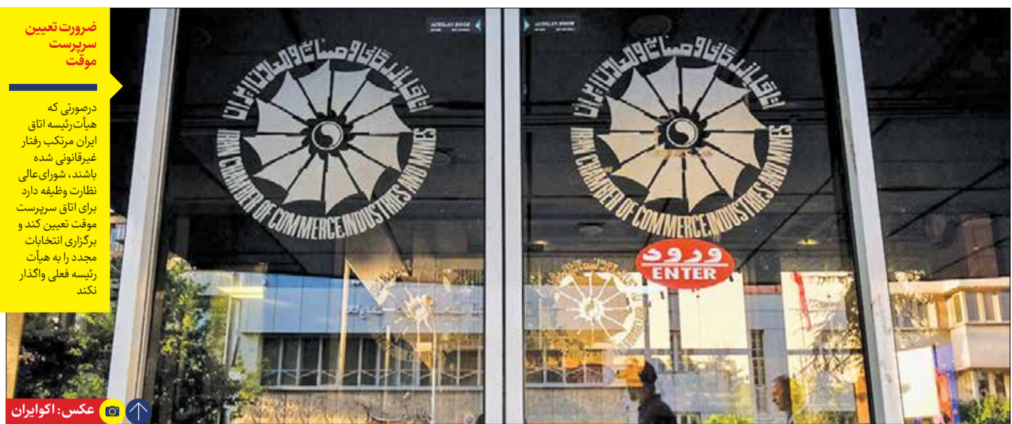
عضو اتاق بازرگانی ایران و عراق در گفت‌وگو با «ایران اقتصادی»:

اصولاً دولت ورودی به بحث اتاق نداشته و تصمیمی در این مورد نگرفته است بلکه به موجب قانون اتاق، چهار عضو دولتی در شورای عالی نظارت (یک