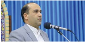
مدیرکل نهاد کتابخانه‌های عمومی خراسان جنوبی: