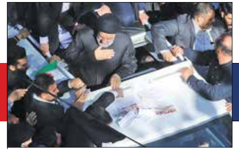
در برخورد با فساد به هیچ کس رحم نخواهم کرد