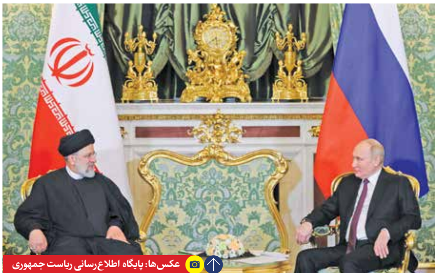
دیدار رؤسای جمهور ایران و روسیه در مسکو