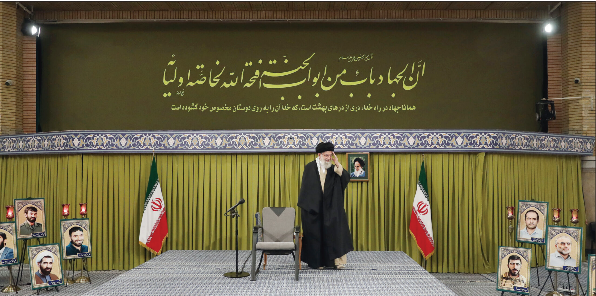
هم‌اگر چهار دره خند، درِ از درهای بهشت است، که خدا آن را به روی دوستان مخصوص خود گشوده است

متن بیانات رهبر معظم انقلاب اسلامی در دیدار دست‌اندرکاران کنگره ۲۴ هزار شهید تهران بزرگ که در تاریخ سه‌شنبه ۳ بهمن ۱۴۰۲ بر گزار شده بود، دیروز در محل بر گزاری همایش در تهران منتشر شد. حضرت آیت‌الله خامنه‌ای در این دیدار، تهران را نماد همه خصوصیات بارز ملت ایران دانستند و با اشاره به نقش آفرینی مردم تهران در حوادث ۱۵۰ سال اخیر و هم‌چنین الهام‌بخش بودن تهران در حوادث انقلاب اسلامی و بعد از پیروزی انقلاب گفتند: تهران پیشگام و انقلابی، شامنامه واقعی این شهر بزرگ است که باید حوادث و جزئیات آن تدوین و برای نسل جوان تبیین شود.