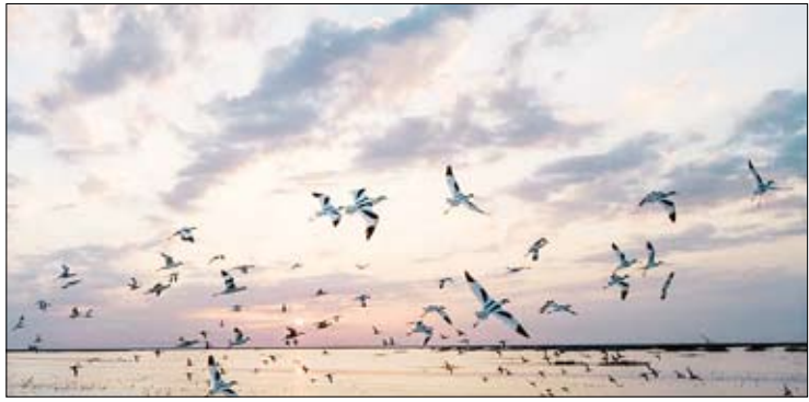
هورالعظیم آخرین بازمانده تالاب‌های بین‌النهرین ایسنا